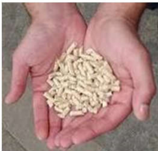
Figura 1. Según la RAE una pella es "Una masa que se une y aprieta, regularmente en forma redonda".

En Cuba, ha ocurrido un proceso parecido, aunque producto de las dificultades económicas ocurridas en los últimos 30 años el uso de este material se ha agudizado más, por lo cual el libro brinda interesantes comentarios de sus autores. Puede considerarse que la obra permite constatar que hay una oportunidad de recuperar y potenciar el uso de la biomasa forestal como una fuente de energía sostenible. Su coordinador nos demuestra que «Esto se debe a una combinación de factores: la gestión de los montes realizada en el pasado, la situación del mercado de los combustibles fósiles o el desarrollo tecnológico del sector. De hecho, se han creado nuevos tipos de combustible a partir de la leña y el serrín, como astillas de tamaños homogéneos, briquetas y «pellets», que son pequeñas pellas cilíndricas de serrín prensado (Ver figura 1).